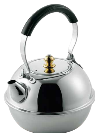
18-8すず型湯沸ジュニア 18-8 Tin water kettle junior 18-8 Stainless Steel