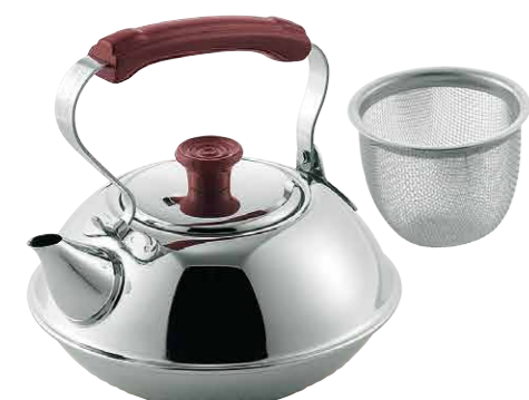
18-8ラッキーティーポット (茶コシ付) 18-8 Lucky tea pot (includes strainer) 18-8 Stainless Steel