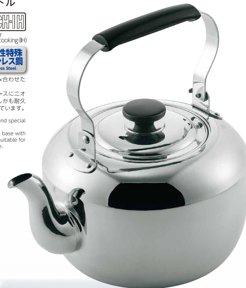
電磁ケトル Electromagnetic induction kettle 電磁調理器対応

The special stainless steel is a magnetic chrome stainless steel base with Niobium (Nb) Copper added to form a new type of material suitable for Induction cooking surfaces. Moreover it is a strong and durable.