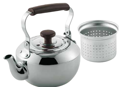
18-8急須 (茶コシ付) 18-8 Tea pot (includes strainer) 18-8 Stainless Steel