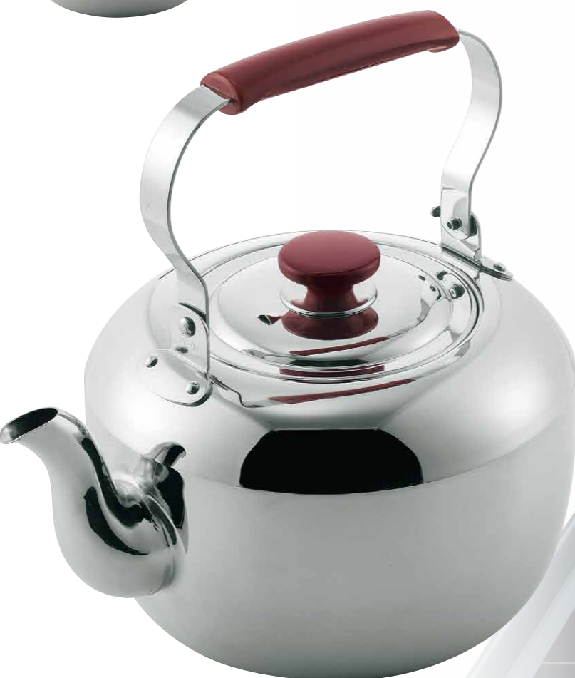
18-8新すず型湯沸 (P柄) 18-8 New tin water kettle (with Bamboo handle finish) 18-8 Stainless Steel