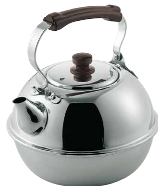
18-8すず型湯沸 18-8 Tin water kettle 18-8 Stainless Steel